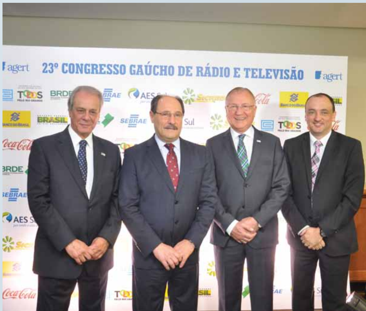
Sartori destaca a pluralidade e a circulação de informações no Congresso da Agert

O governador José Ivo Sartori ressaltou a importância da pluralidade de ideias na sua manifestação na abertura do Congresso Gaúcho de rádio e televisão. Ele afirmou que os associados da Agert permitem a circulação de